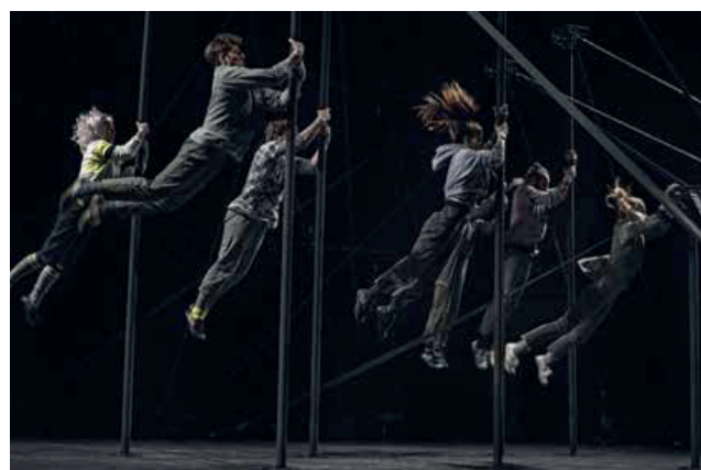
Les Voix de la Forêt