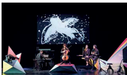
Le Carnaval des animaux

« Si à la lecture de cet article, il est peut-être trop tard pour savourer les acrobaties drolatiques d'inTarsi avec vos enfants (29 septembre), notre malle aux trésors recèle d'autres pépites qui s'égrènent dans une programmation haute en couleur.