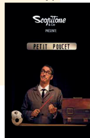
Le Petit Poucet © Grégory Bouche