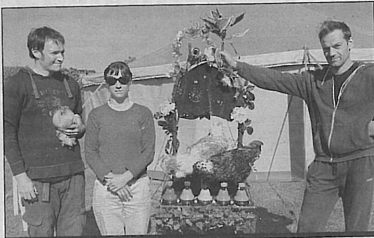
« Prends-en de la graine » se joue sur le territoire communautaire

Les prochaines représentations : le mardi 7 juin à Veulettes-sur-Mer, le mercredi 8 à Canouville, le vendredi 10 à Blossville-sur-Mer, le samedi 11 à Gueutteville-les-Grès, le mercredi 22 à Veules-les-Roses, le jeudi 23 à Saint-Valery-en-Caux. Réservation obligatoire : rayon-vert@ville-saint-valery-en-caux.fr / Tél. 02.35.97.25.41.