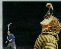
D'anciens élèves de l'École nationale du cirque de Châtellerauld viennent présenter leur spectacle.

> Poitiers « Circus Cirkus » : spectacle dans la tradition du cirque avec les artistes du cirque Octave Singulier. Vendredi, à 19 h ; samedi et dimanche, à 15 h, sous chapiteau, rue Champlain, à Beaulieu. Tarifs : 14 et 8 € de 3 à 12 ans, gratuit - 3 ans. Réservations vivement recommandées : 05.49.56.54.26 ou 06.87.18.42.43.